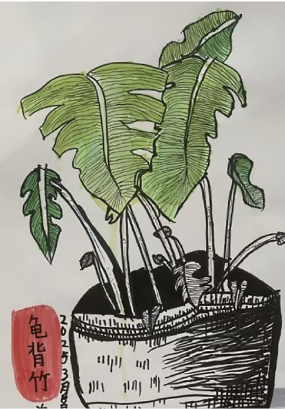
龟背竹 新世纪学校二(1)班 姜 妤 指导老师 魏骏飞

这次庙源溪畔的露营之旅,不仅是一次出游,更是一段关于亲情、友情与自然的美好记忆。它教会了我,幸福往往就藏在这些平凡而又珍贵的瞬间里,只要我们用心去感受,生活处处皆是风景。 大成小学四(1)班 单梦欣 指导老师 孙 萍